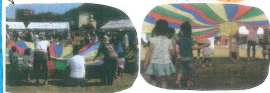
昨年の様子 沢山のひだまりさんが集まりました!!