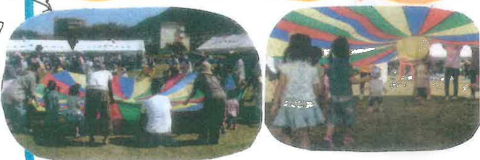
昨年の本誌も、沢山のひだまりさんが集まりました!