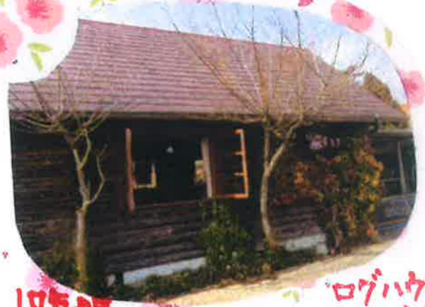
17年10月、ロギハウス、ありがとうございました

突然の休所のお知らせにご迷惑をおかけします。外に思うように出られず、 ストレスをかかえていた気がなっています。でも、どんな時でも、子どもたちは 元気!! その姿に支えられながら明るく、 元氣張っていきましよう。またどこかでお会い できるのを楽しみにしています♡ (何かありましたら、電話されて下さいね♡)