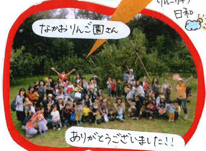
なほおりんご園エん

12月3日(月)は、 「777-アレンジメント」を 楽しもうがあります。 ぜひご参加下さい♡ 来月、募集をかけます。