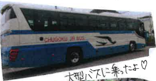
大型バスに乗ったよ!